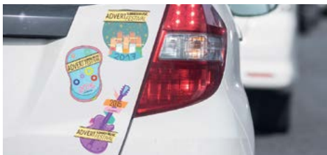
ETIQUETAS E ADESIVOS