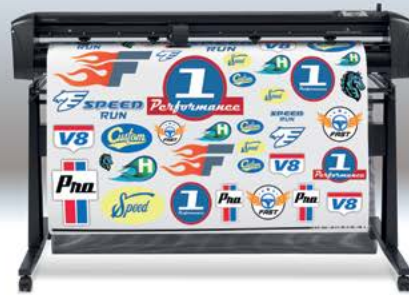
Cortadora HP Látex 54