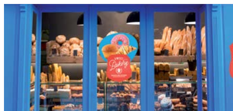
IMAGENS PARA VITRINES