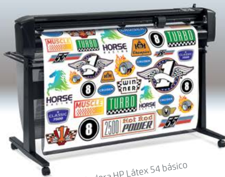
Cortadora HP Látex 54 básico

Amplie seus negócios ao aprimorar sua impressora HP Látex com nosso exclusivo fluxo de trabalho de impressão E recorte 1