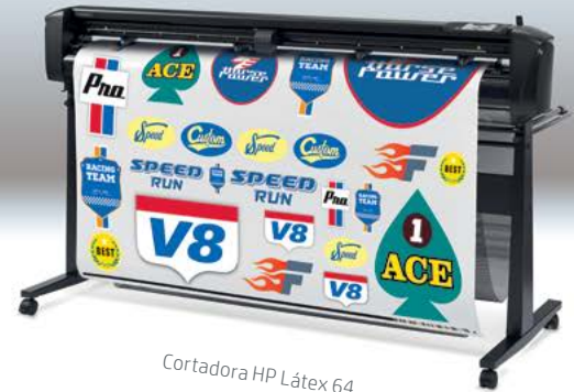
Cortadora HP Látex 64