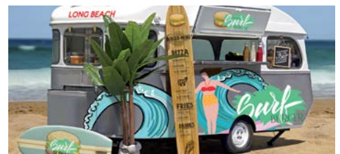
ENVELOPAMENTO DE VEÍCULOS

©Copyright 2018 HP Development Company, L.P. As informações contidas neste documento estão sujeitas a alterações sem aviso.