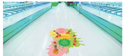
IMAGENS PARA PISO